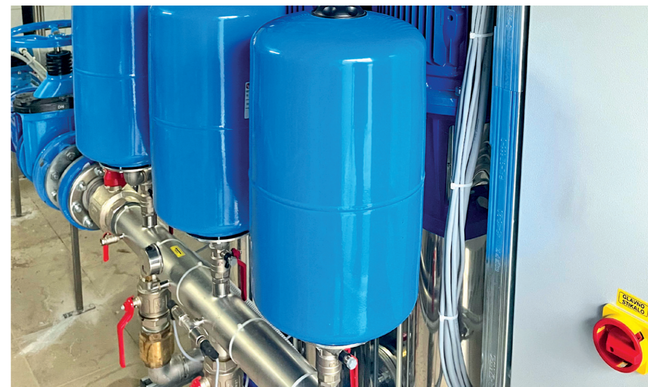
Črpališče Mačkovci – Puconci