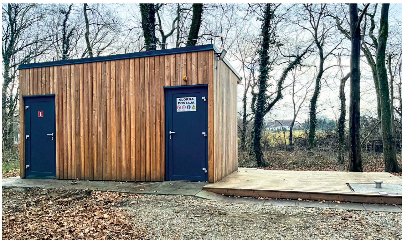
Vodni vir (Fazanerija) – Murska Sobota