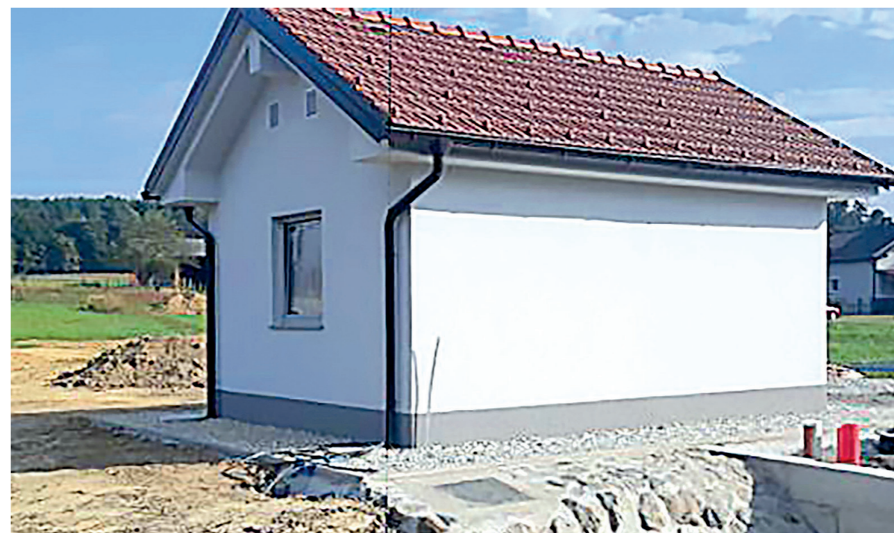
Črpališče Markovci – Šalovci