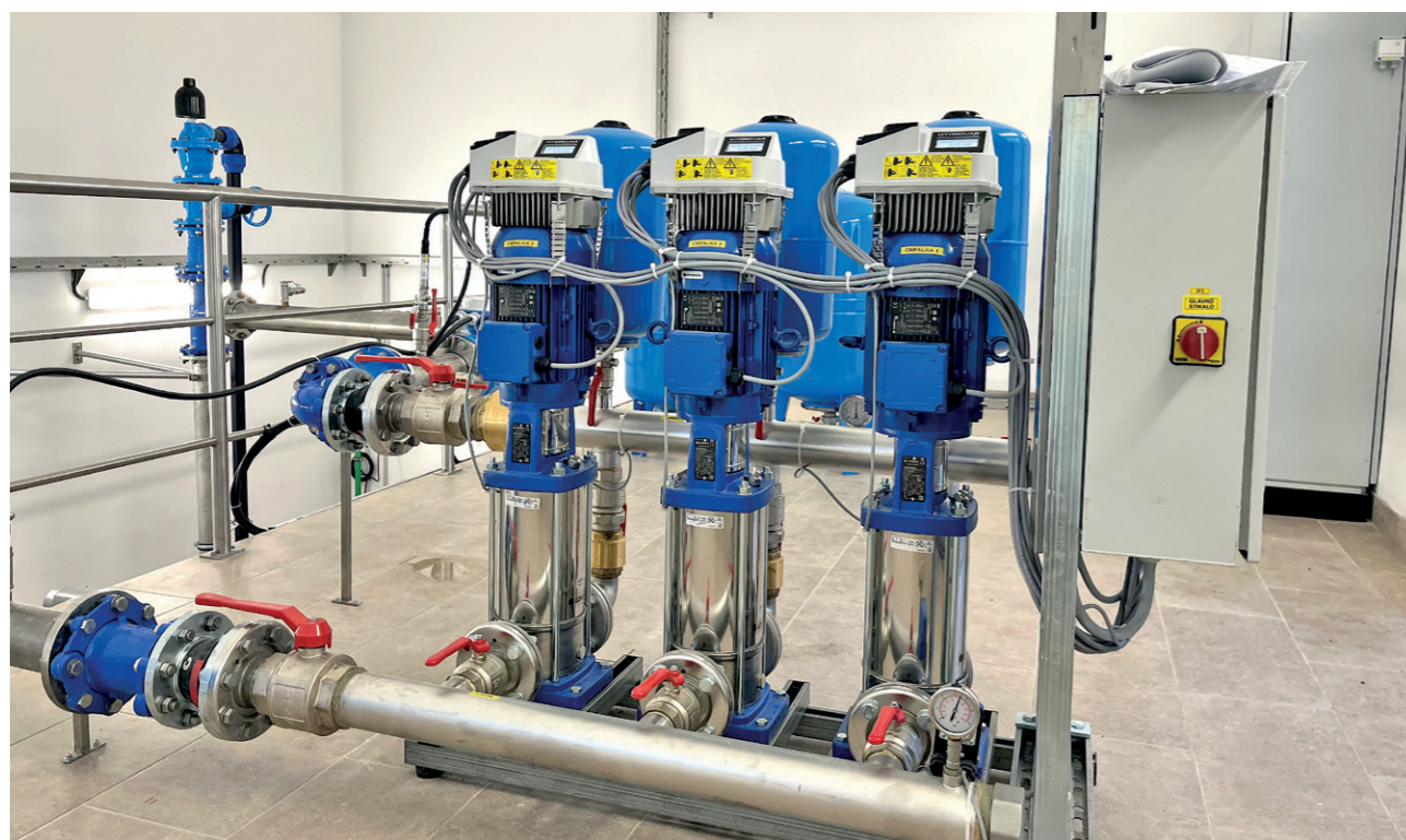
Črpališče Krajna – Tišina