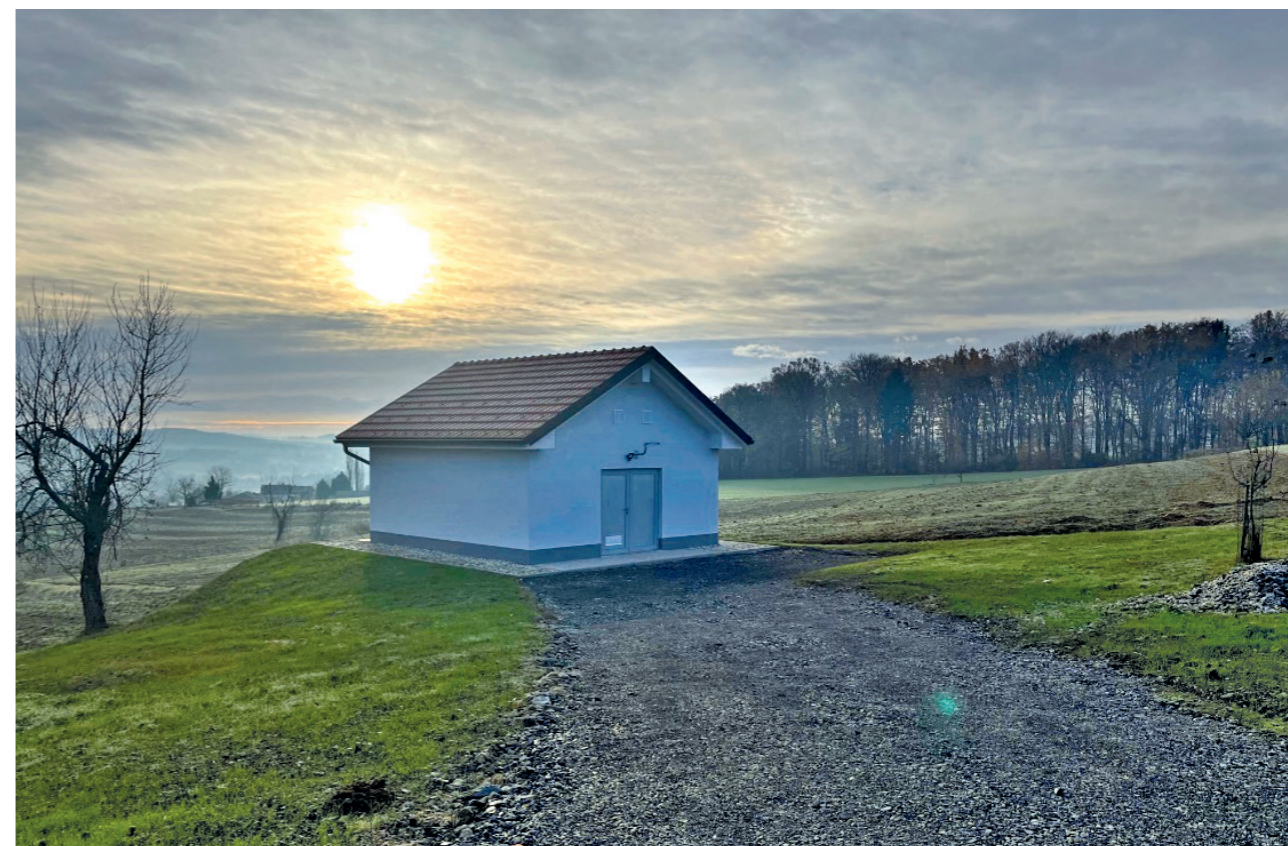
Črpališče Buček – Rogašovci