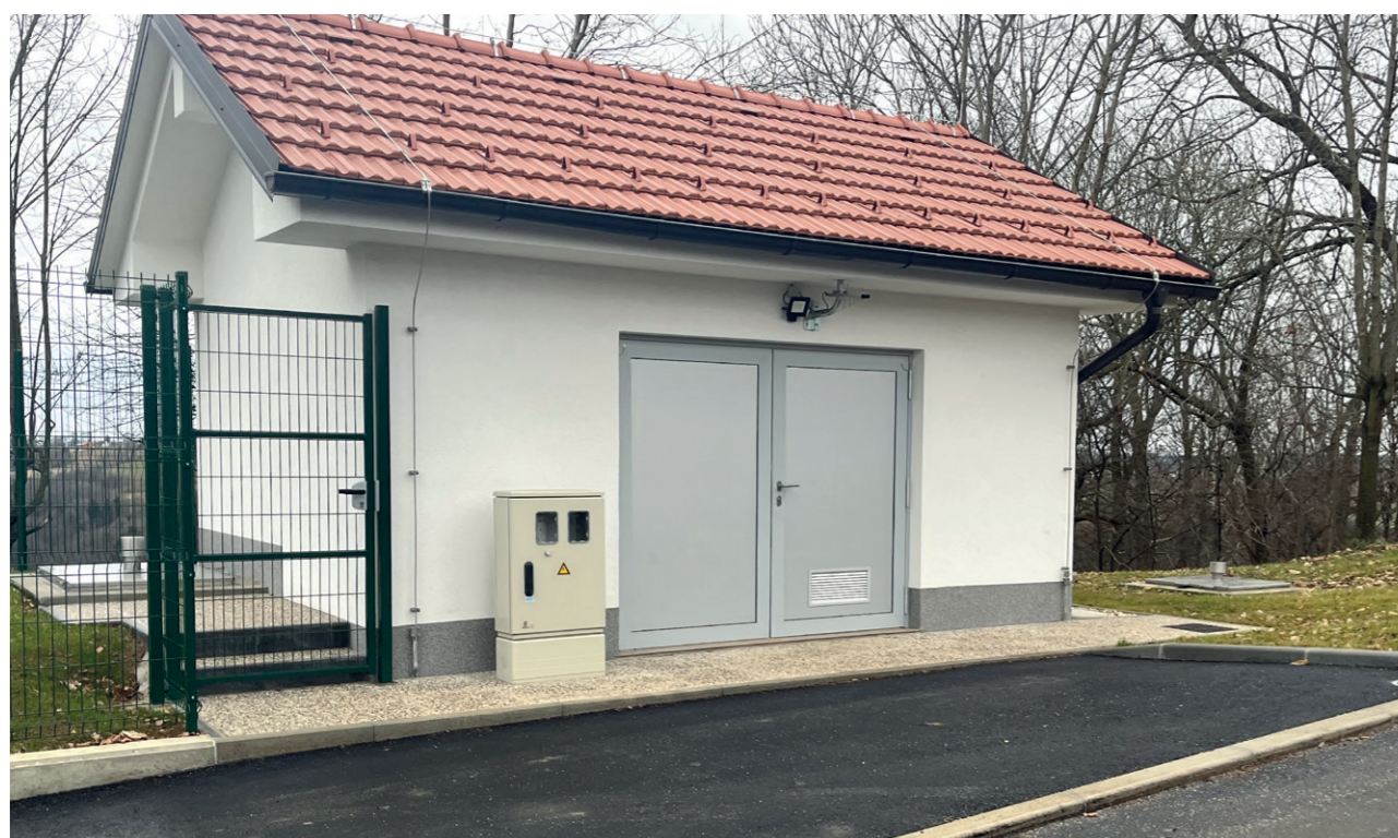
Črpališče Gerlinci – Cankova