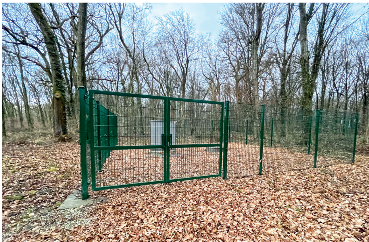
Vodnjak (Fazanerija) – Murska Sobota