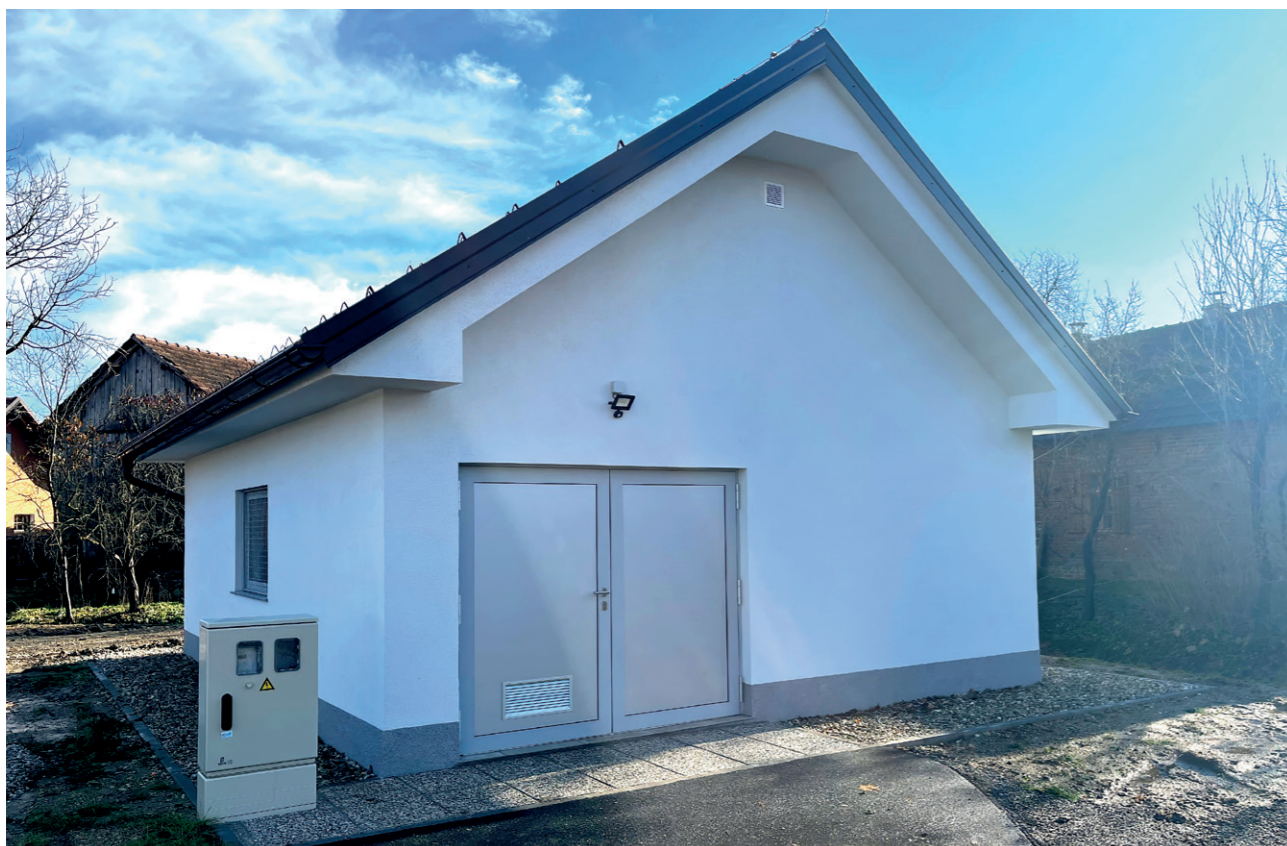
Črpališče Filovci – Moravske Toplice