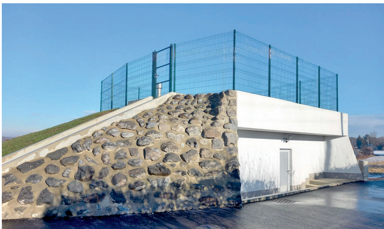
Vodohran Filovci – Moravske Toplice