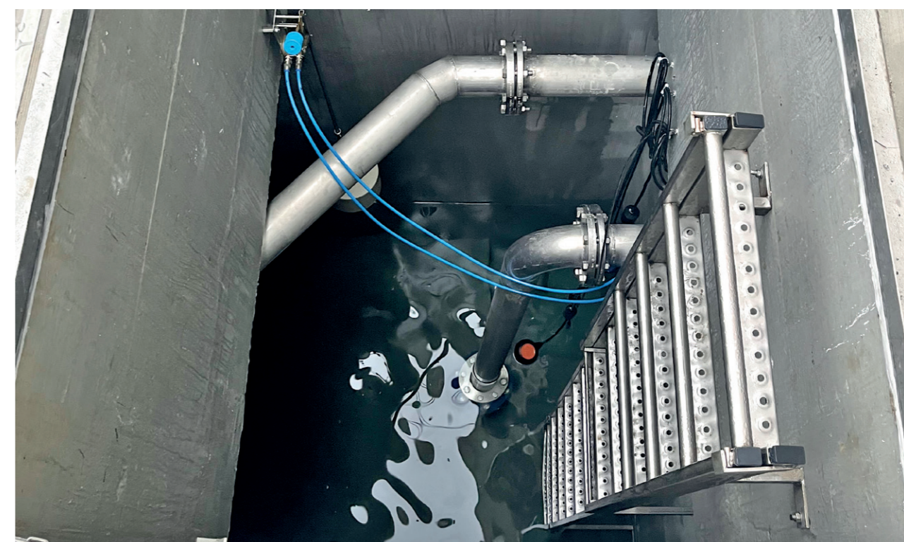
Črpališče Gerlinci – Cankova