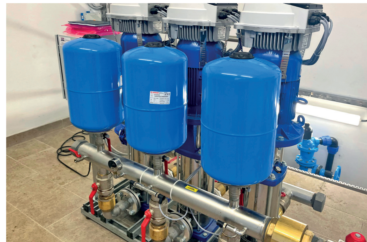
Črpališče Gerlinci – Cankova