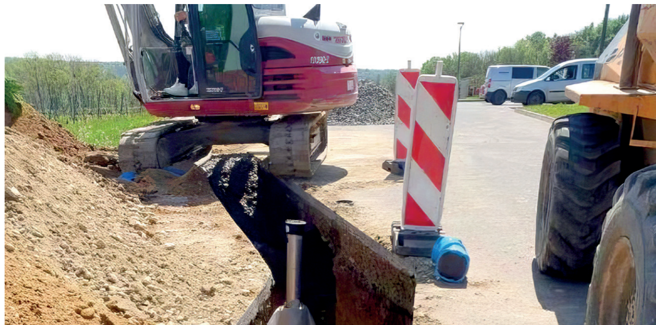
VMP – Puconci, 5. 5. 2023

Na izvedbo pogodbenih del je vplivala splošna politična in gospodarska kriza v obdobju izvajanja del, ki se je odrazila v podražitvah materialov in daljših dobavnih rokih le-teh, ki so vodili do podražitve projekta. Zaradi teh ovir se je pogodbena vrednost povečala in znaša 38.160. 205, 71 EUR z DDV.