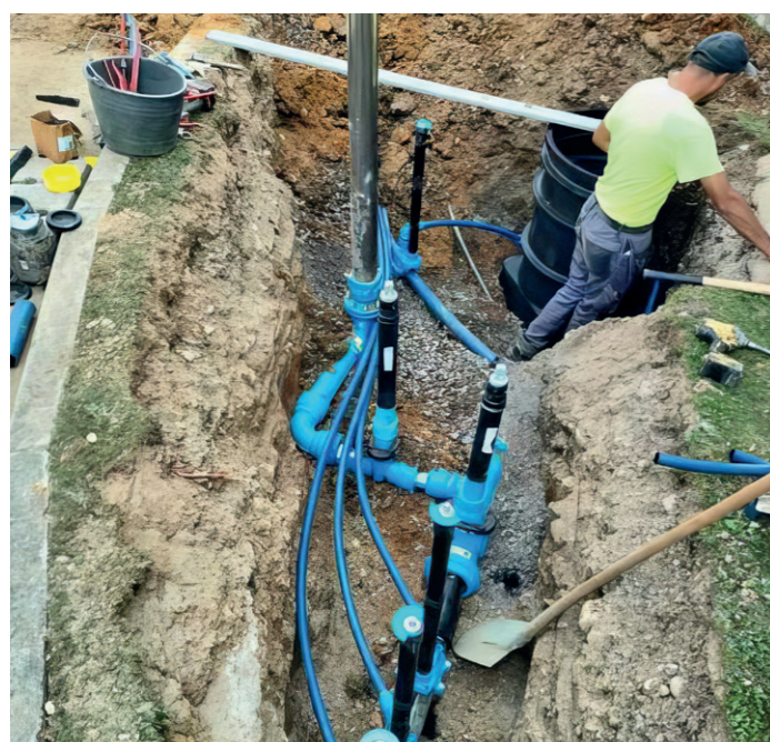
SR 3/7 – Rogašovci, 24. 9. 2023