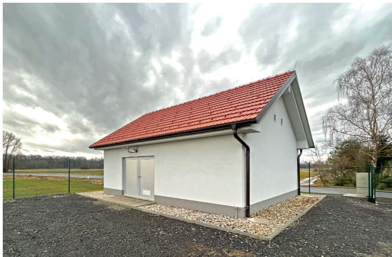
Črpališče Krajna – Tišina