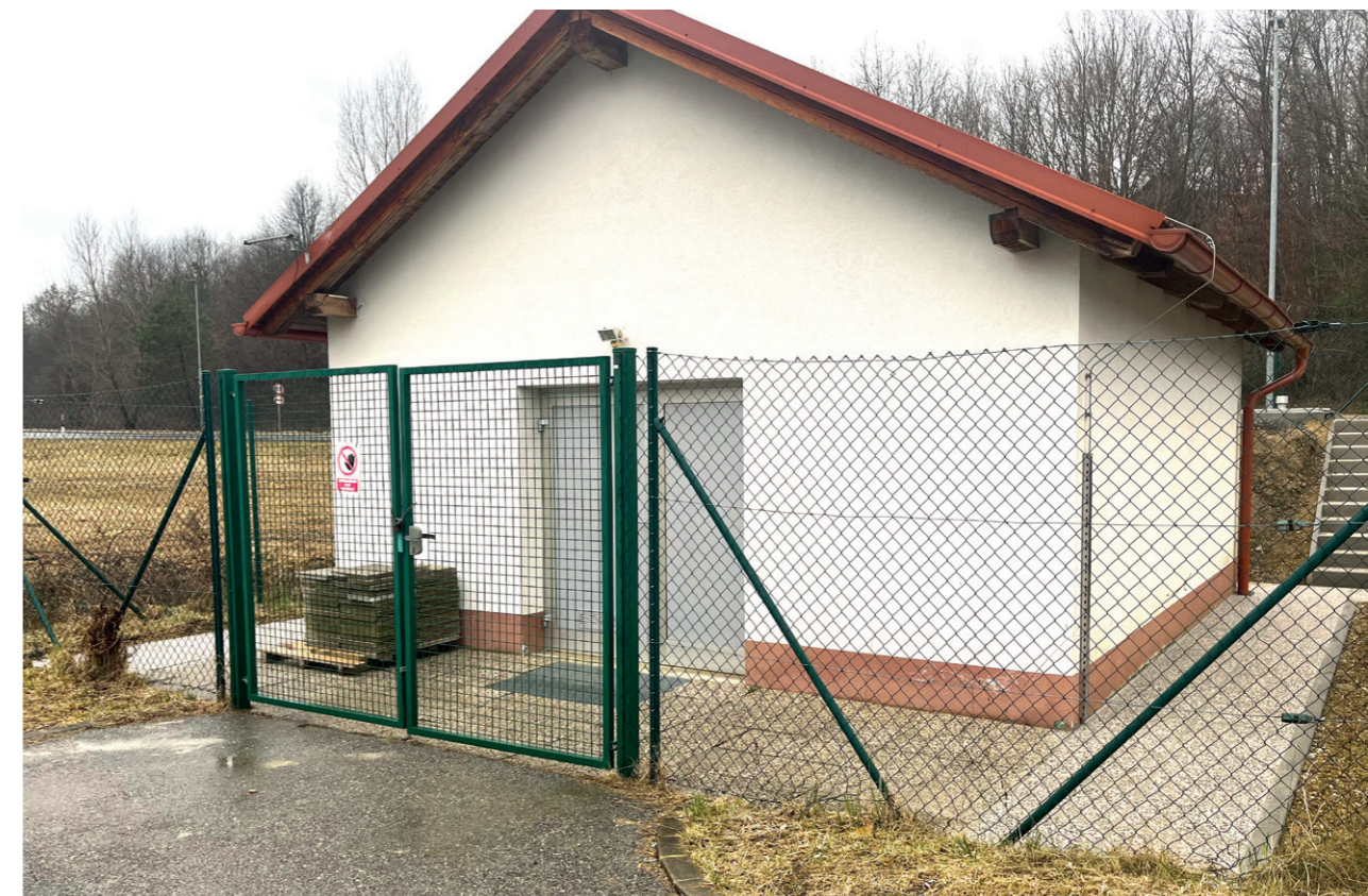
Črpališče Mačkovci – Puconci