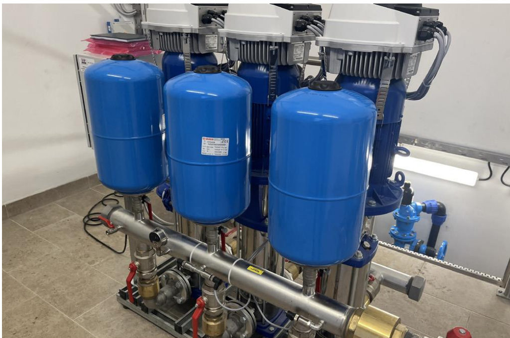
Črpališče Gerlinci – Cankova