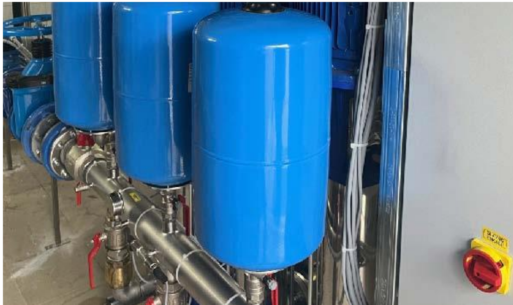
Črpališče Mačkovci - Puconci

ROGAŠOVCI, BELTINCI, CANKOVA, GORNJI PETROVCI, GRAD, HODOŠ, KUZMA, MORAVSKE TOPLICE, MO MURSKA SOBOTA, PUCONCI, ŠALOVCI, TIŠINA.