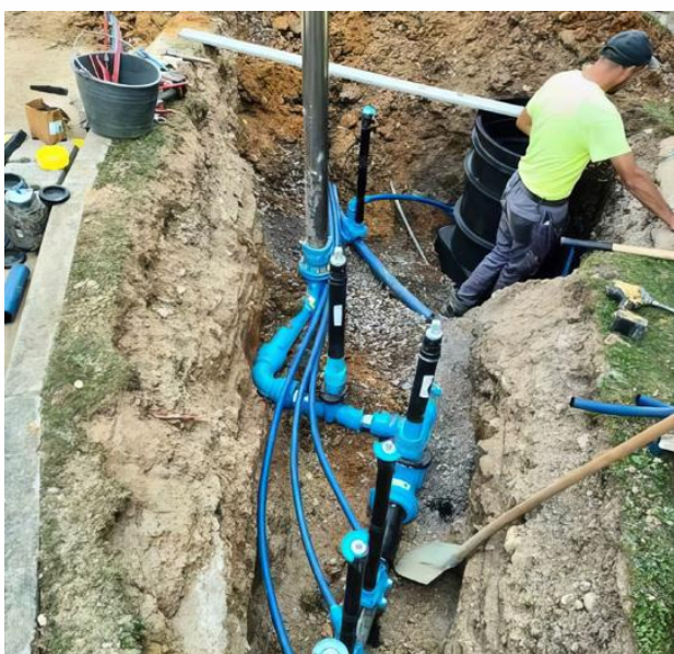
SR 3/7 – Rogašovci, 24. 9. 2023