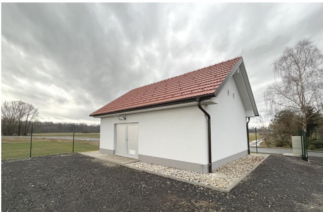
Črpališče Krajna - Tišina