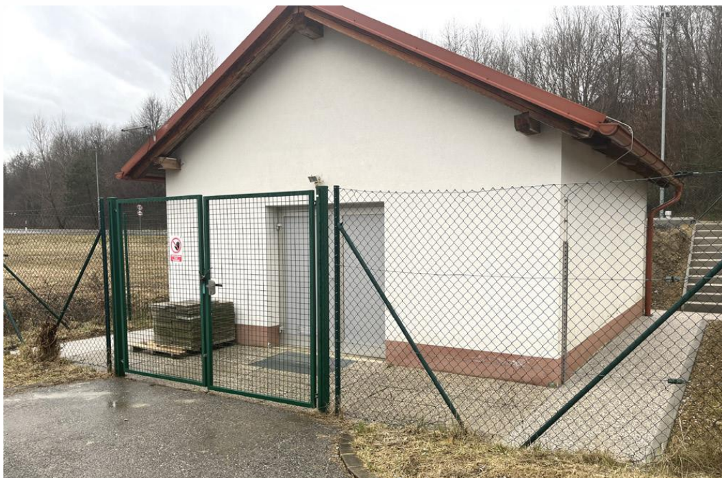
Črpališče Mačkovci – Pucanci