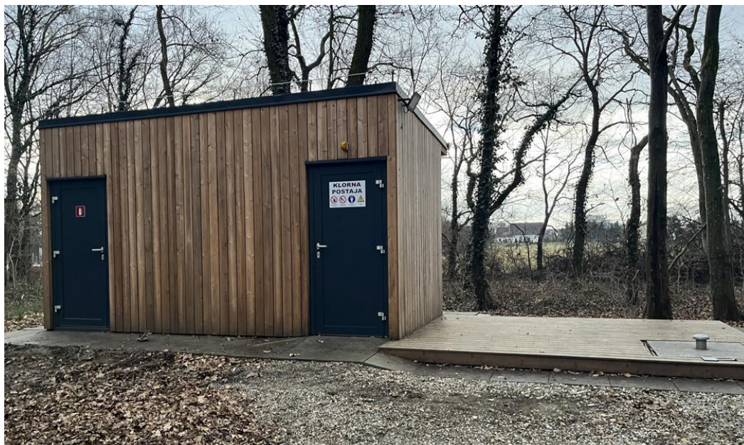
Vodnjak (Fazanerija) – Murska Sobota

ROGAŠOVCI, BELTINCI, CANKOVA, GORNJI PETROVCI, GRAD, HODOŠ, KUZMA, MORAVSKE TOPLICE, MO MURSKA SOBOTA, PUCONCI, ŠALOVCI, TIŠINA.