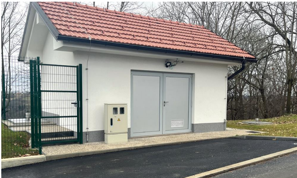
Črpališče Gerlinci – Cankova

ROGAŠOVCI, BELTINCI, CANKOVA, GORNJI PETROVCI, GRAD, HODOŠ, KUZMA, MORAVSKE TOPLICE, MO MURSKA SOBOTA, PUCONCI, ŠALOVCI, TIŠINA.