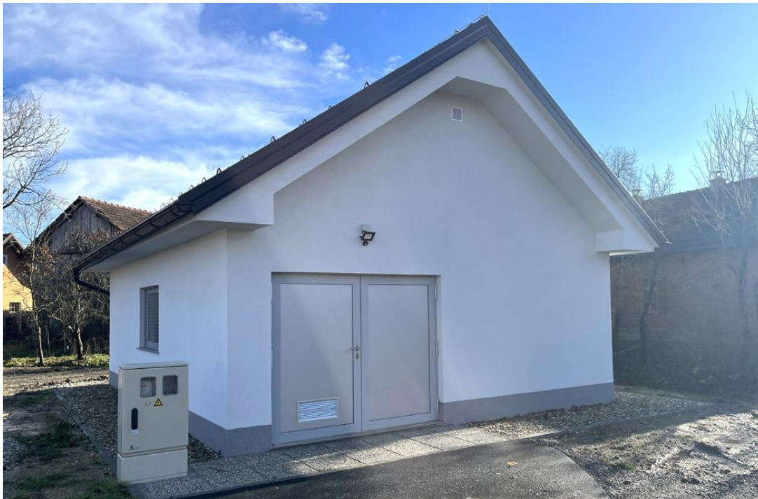
Črpališče Filovci – Moravske Toplice

ROGAŠOVCI, BELTINCI, CANKOVA, GORNJI PETROVCI, GRAD, HODOŠ, KUZMA, MORAVSKE TOPLICE, MO MURSKA SOBOTA, PUCONCI, ŠALOVCI, TIŠINA.