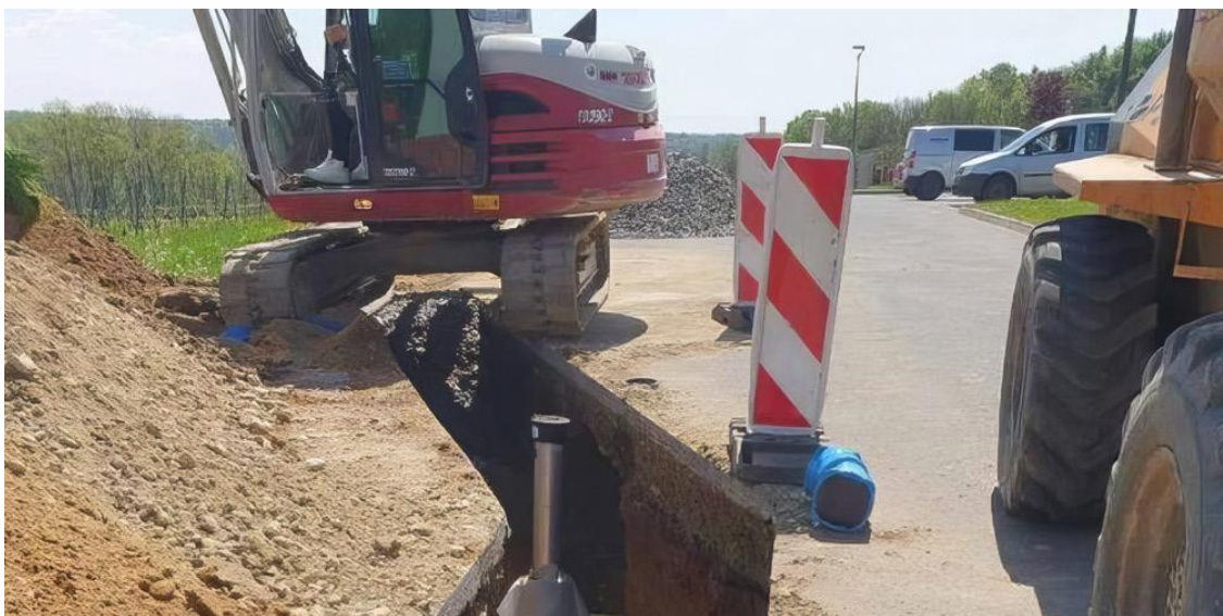
VMP – Puconci, 5. 5. 2023

Na izvedbo pogodbenih del je vplivala splošna politična in gospodarska kriza v obdobju izvajanja del, ki se je odrazila v podražitvah materialov in daljših dobavnih rokih le-teh, ki so vodili do podražitve projekta. Zaradi teh ovir se je pogodbeni vrednost povečala in znaša 38.160. 205, 71 EUR z DDV.