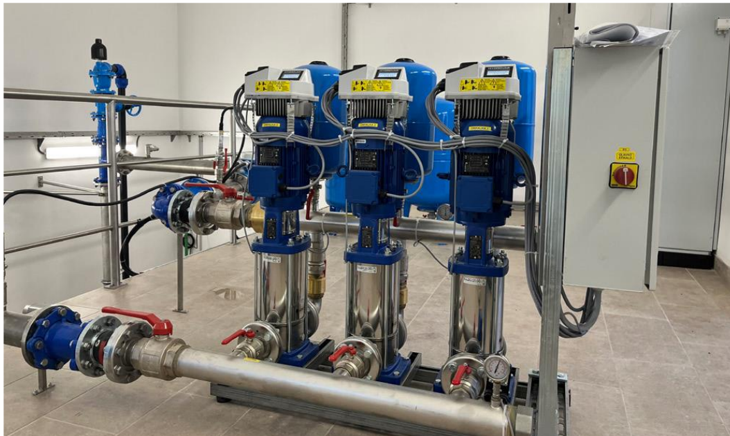
Črpališče Krajna - Tišina

ROGAŠOVCI, BELTINCI, CANKOVA, GORNJI PETROVCI, GRAD, HODOŠ, KUZMA, MORAVSKE TOPLICE, MO MURSKA SOBOTA, PUCONCI, ŠALOVCI, TIŠINA.