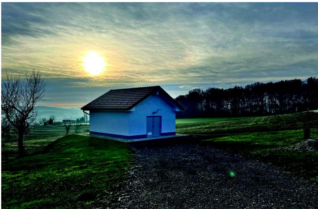
Črpališče Buček – Rogašovci

ROGAŠOVCI, BELTINCI, CANKOVA, GORNJI PETROVCI, GRAD, HODOŠ, KUZMA, MORAVSKE TOPLICE, MO MURSKA SOBOTA, PUCONCI, ŠALOVCI, TIŠINA.