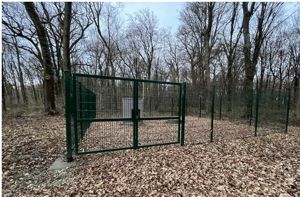
Vodnjak (Fazanerija) – Murska Sobota